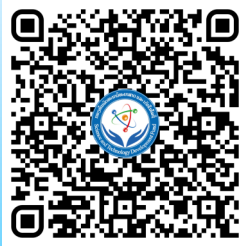
QR Code ບັນດາເອກະສານນິຕິກຳ ກອງທຶນພັດທະນາວິທະຍາສາດ ແລະ ເຕັກໂນໂລຊີ

ຕັ້ງຢູ່ໃນເຂດສຳນັກງານນາຍົກລັດຖະມົນຕີ (ຊັ້ນ1 ຕຶກ100) ຖະໜົນ ນາໂຮ່ດຽວ, ໂທລະສັບ/ແຟັກ: 021 243311 ບ້ານ: ສີດຳດວນ, Website: http://laofostd.gov.la ເມືອງ ຈັນທະບູລີ, Email: stdflao@gmail.com ນະຄອນຫຼວງວຽງຈັນ.